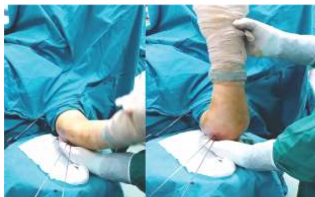
Slika 3. Prikaz testiranja stabilnosti nakon osteosinteze perkutanom metodom

Nakon adekvatne preoperativne pripreme u opštoj anesteziji, bez korišćenja povese-Turniquet, uz korišćenje C luka, uradi se repozicija i nakon dobijanja zadovoljavajuće pozicije ulomaka isti se fiksiraju perkutano sa 3 Kiršnerove igle, dve medijalno i jedna lateralno.