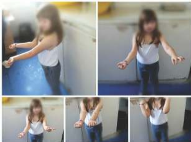
Slika 5. Prikaz opsega pokreta nakon završetka lečenja i obavljene fizikalne terapije, sedam nedelja nakon operacije

Nakon završene fizikalne terapije u potpunosti vraćeni pokreti fleksije i ekstenzije te pronacije i supinacije.