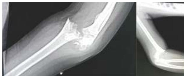
Slika 2. Preoperativni snimak povređene leve ruke u AP i LL poziciji

Devojčica, stara 8 godina, zadobila povredu pri padu tokom igranja. Inicijalno zbrinuta u drugoj ustanovi, gde je urađena repozicija i postavljena imobilizacija. Na našem odeljenju klinički i radiografski pregledana. Urađena radiografija levog lakta u dva pravca pri čemu je povreda definisana kao suprakondilarni prelom tip III po Gartlandu. Lokalni NC nalaz u trenutku prijema je bio uredan.